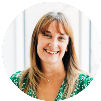
Ysgrifennwyd gan Dr Rachel Dodge Swyddog Datblygu Cymwysterau

Rydym yn falch iawn bod ein cymhwyster newydd, Bagloriaeth Sgiliau Uwch Cymru wedi ei gymeradwyo'r haf hwn. Mae'n gymhwyster cyffrous ac arloesol a fydd yn disodli'r Dystysgrif Her Sgiliau Uwch bresennol. Bydd ar gael i ddysgwyr o fis Medi 2023, ac yn cael ei ddyfarnu am y tro cyntaf yn haf 2025.