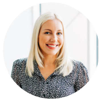
Elizabeth East Uwch Bartner Busnes AD

Fel corff, rydym yn parhau i chwilio am ffyrdd i wella, gan sicrhau bod gennym yr egwyddorion a'r arferion cywir ar waith. Rydym am i'n pobl deimlo eu bod yn cael eu gwerthfawrogi a bod yn rhan o gorff lle gallant dyfu a datblygu.