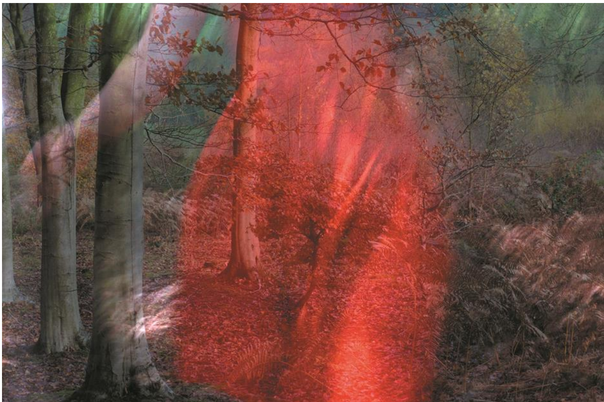
©Helen Sear, The Company of Trees , 2015 Comisiynwyd gan Gyngor Celfyddydau Cymru mewn partneriaeth â Ffotogallery ar gyfer Cymru yn Fenis/Wales yn Venice la Biennale di Venezia 2015.

Efallai yr hoffech chi ystyried y berthynas rhwng pobl a'r byd naturiol.