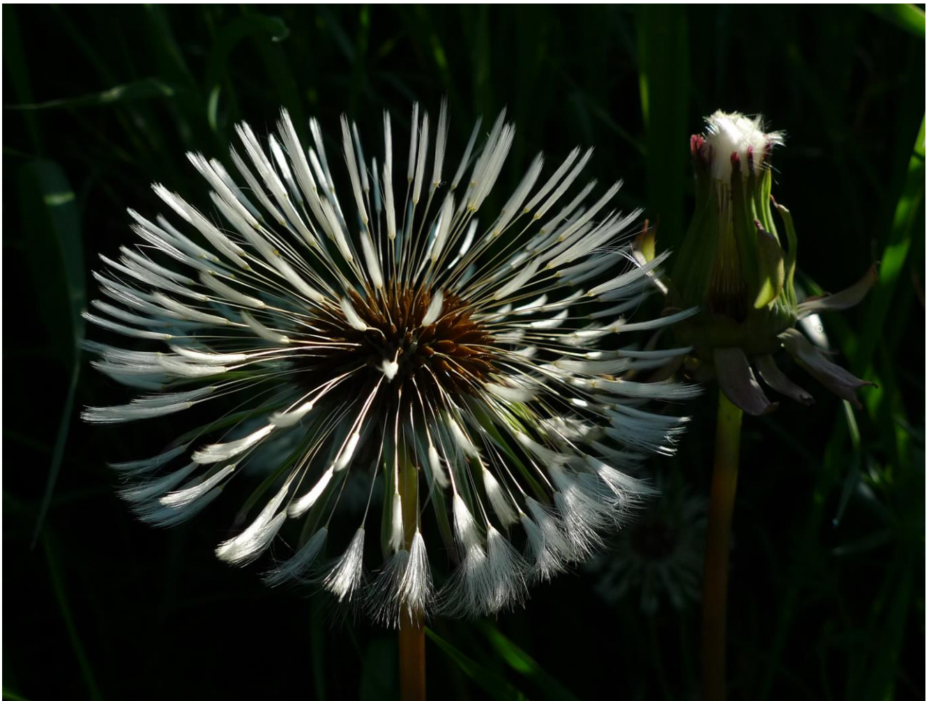
Delwedd uchaf ar y chwith, gyda chydabyddiaeth i Carol Gwizdak, dylunydd/gwneuthurwr gemwaith..

Gallech gymryd eich ysbrydoliaeth o'r amrywiaeth o ffurfiau bregus sydd o'n cwmpas.