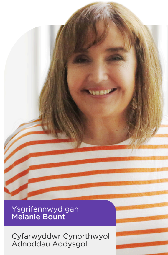
Ysgrifennwyd gan Melanie Bount

Bydd y gyfres lawn ar gael rhwng mis Ionawr a mis Mehefin 2025, gyda 130 o becynnau newydd ar draws y don gyntaf o gymwysterau a gaiff eu cyhoeddi erbyn mis Medi 2025. Bydd yr adnoddau hyn yn werthfawr i addysgwyr, gan wella'r profiad dysgu a hwyluso gwersi difyr.