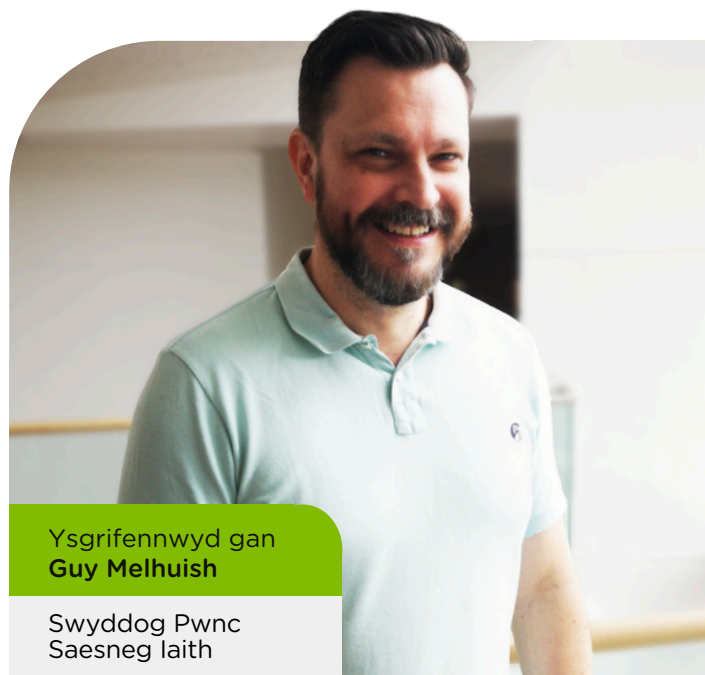
Ysgrifennwyd gan Guy Melhuish

Fel aelodau hanfodol o dîm CBAC, rydym yn bodloni anghenion ysgolion, colegau, athrawon a darlithwyr drwy ddarparu deunyddiau hanfodol fel negeseuon i atgoffa ynghylch terfynau amser, dadansoddiadau o feini prawf asesu ac adnoddau ychwanegol.